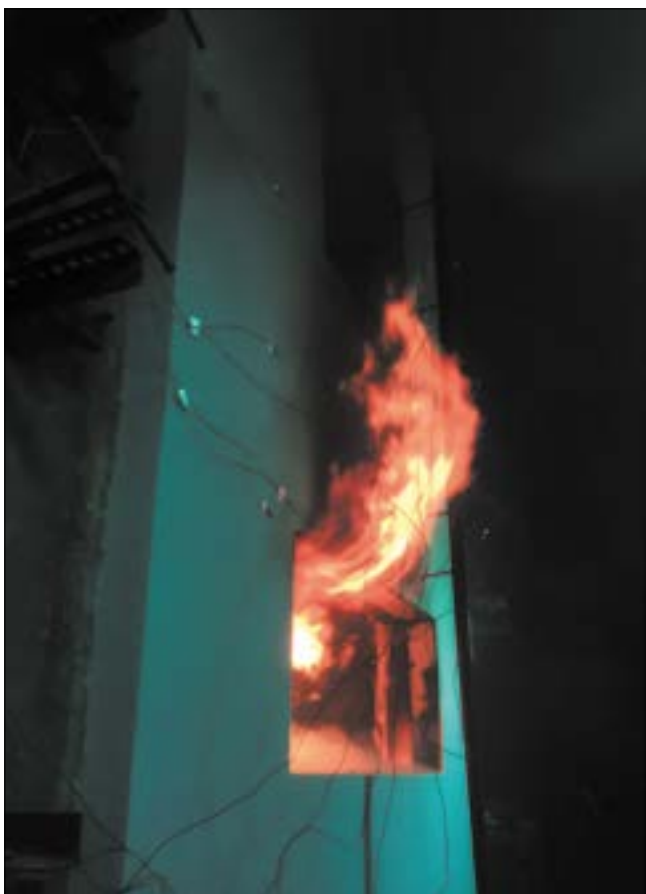
Теплоизоляционная система с тонким штукатурным слоем и плитами ПЕНОПЛЭКС® Фасад во время испытаний

таний на пожарную опасность». Об этом свидетельствуют заключение и отчет об испытаниях, в ходе которых ПЕНОПЛЭКС® присужден класс пожарной опасности КО.