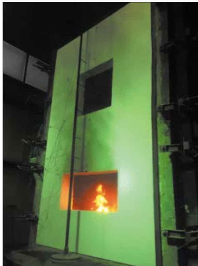
Теплоизоляционная система с тонким штукатурным слоем и теплоизоляционными плитами ПЕНОПЛЭКС® Фасад после испытаний