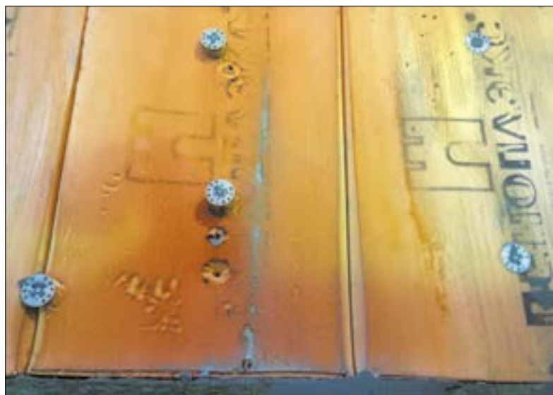
Плиты ПЕНОПЛЭКС® после испытаний

Ответственность за пожар несут всегда люди. В одних случаях возникновение пожаров связано с нарушением