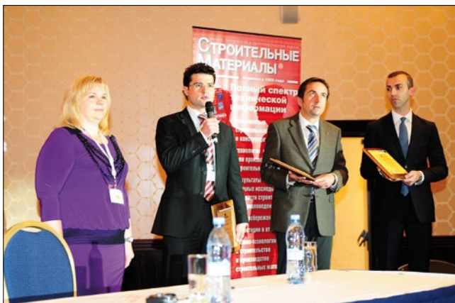
Традиционно генеральным спонсором конференции выступило подразделение Группы ЛСР «ЛСР. Стеновые материалы – Северо-Запад». Зарубежными партнерами в этом году стали итальянская компания BEDESCHI S.p.A. («Бедески») и немецкая компания Händle («Хендле»).

30–31 мая 2013 г. в Москве с успехом прошла XI Международная научно-практическая конференция «Развитие керамической промышленности России – КЕРАМТЭКС-2013». В ее работе приняли участие более 220 руководителей и ведущих специалистов предприятий производителей керамических стеновых материалов, фирм-производителей технологического оборудования, инжиниринговых компаний, научно-исследовательских организаций и профильных вузов из 31 региона России от Калининграда до Хабаровска, от Санкт-Петербурга до Краснодара, и 10 зарубежных стран – Австрии, Германии, Греции, Голландии, Испании, Италии, Украины, Франции, Чехии, Швейцарии.