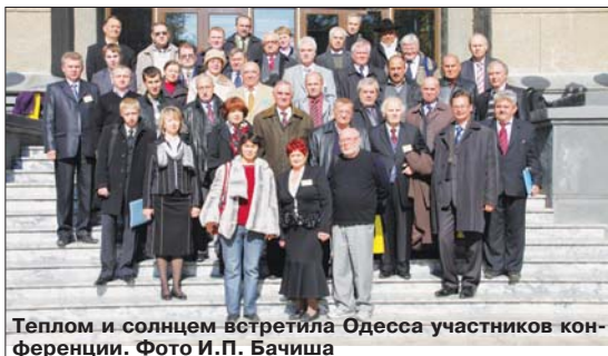
Теплом и солнцем встретила Одесса участников конференции.