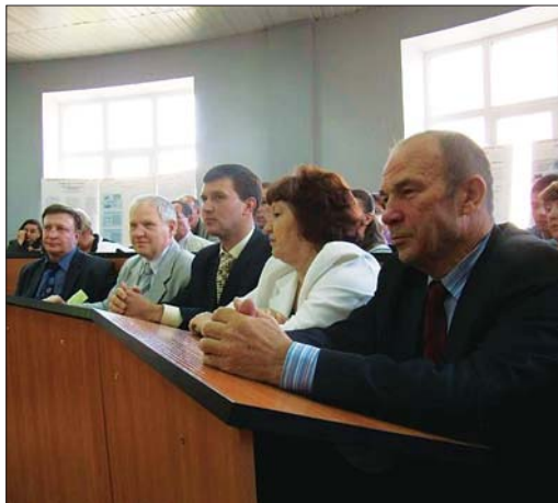
Докладчиков слушают с большим интересом