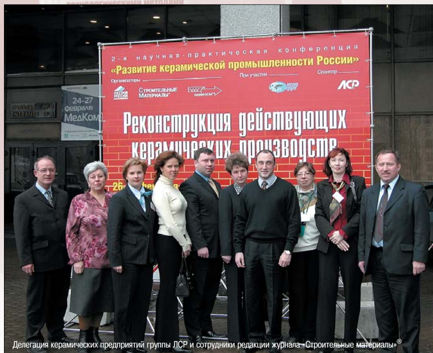
Делегация керамических предприятий группы ЛСР и сотрудники редакции журнала «Строительные материалы» ®